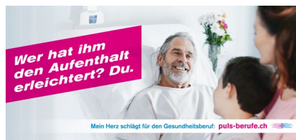
Sujets Spital Kampagne "Mein Herz schlägt für den Gesundheitsberuf"