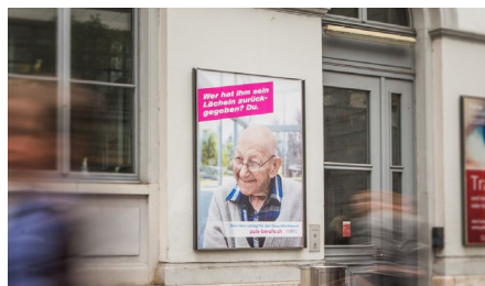
Plakat Bahnhof Stadelhofen

Auf die Gesundheitsberufe aufmerksam machen und das Image bei der Bevölkerung steigern